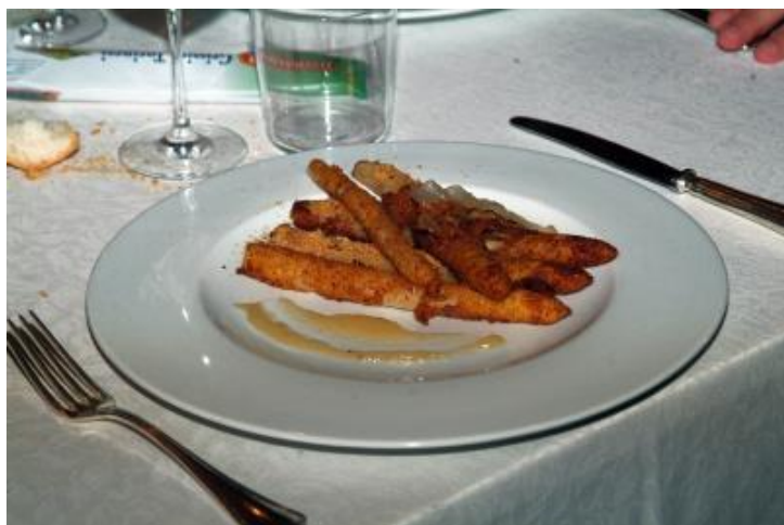
Fantasia di Panettone, amarena, camomilla, macaron.