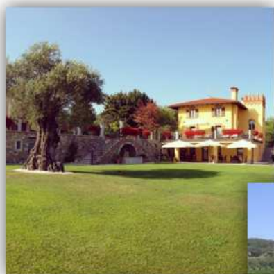
Azienda Agricola Il Roncal